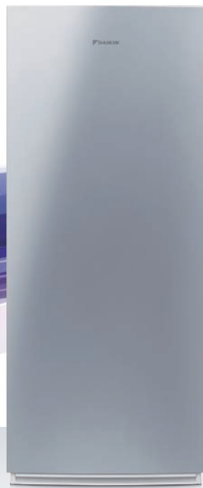
UV 加湿ストリーマ空気清浄機

旭化成株式会社との協業により誕生した、 業界初 ※1 「深紫外線LED265nm」搭載の空気清浄機。