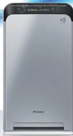
UV ストリーマ空気清浄機